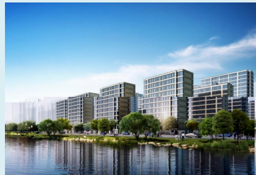
金地融信·悅江府(金華)